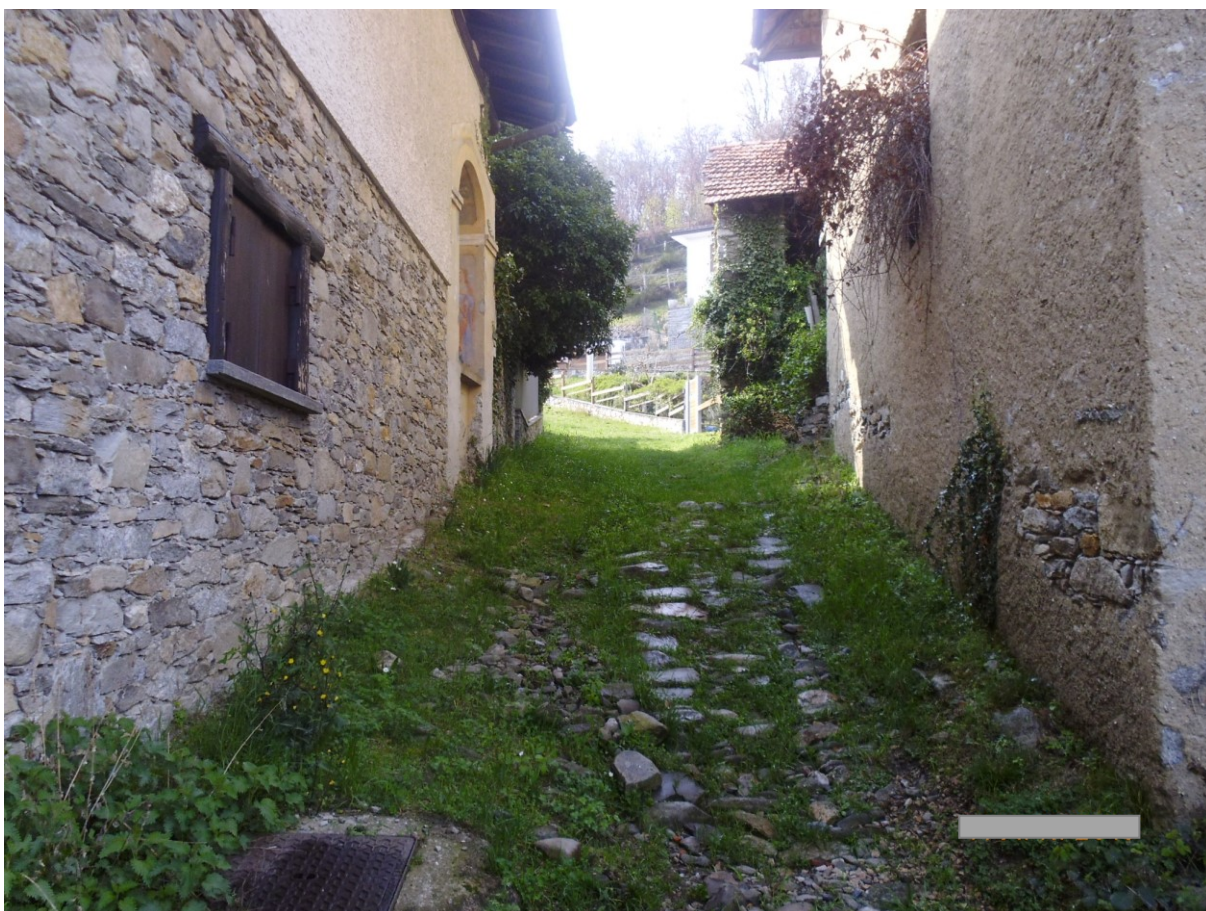
Foto 3: Particolare tratto intermedio con pavimentazione in pietra in totale dissesto