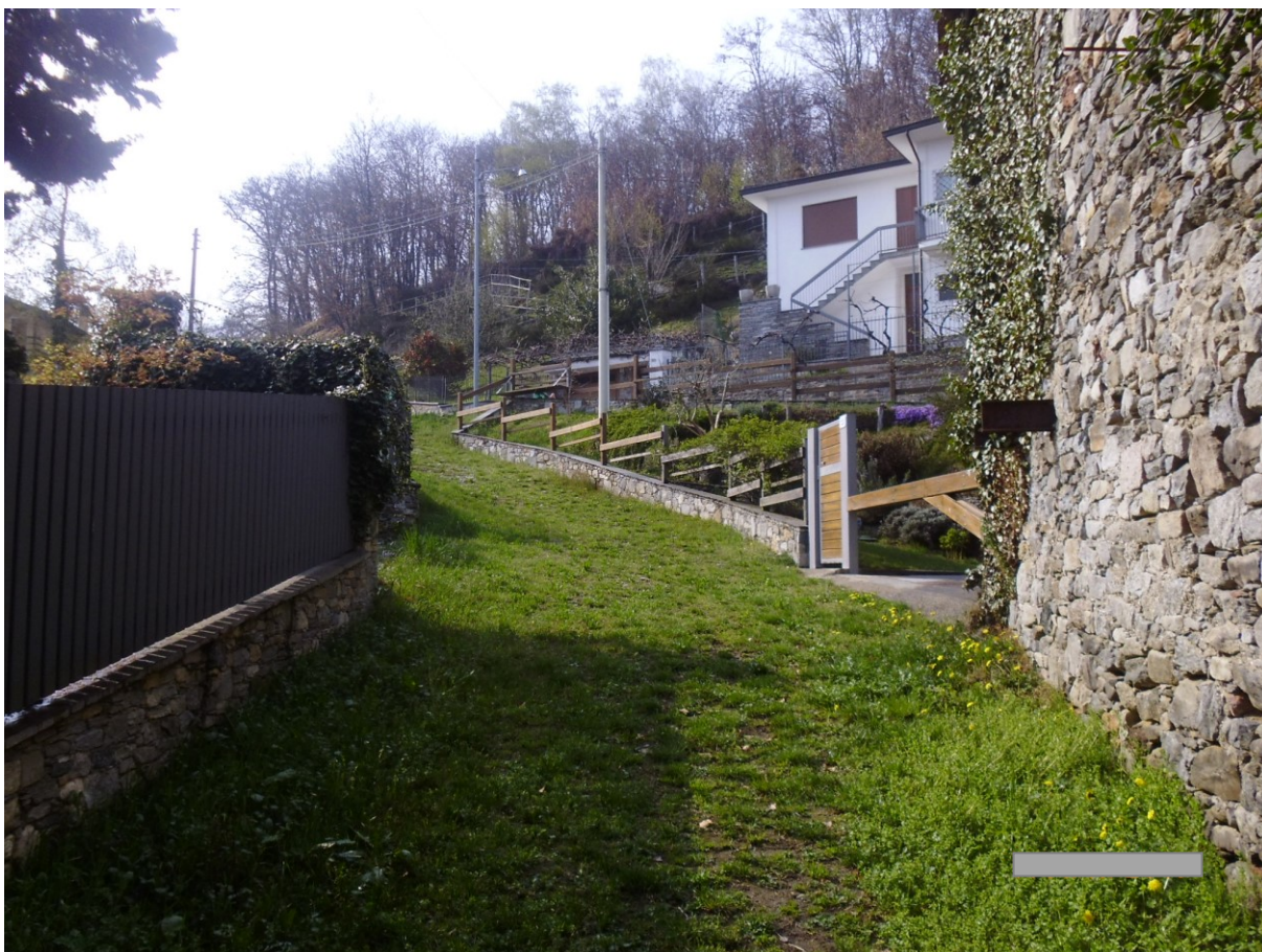
Foto 4: Particolare tratto finale con assenza di pavimentazione e inerbimento del tratto