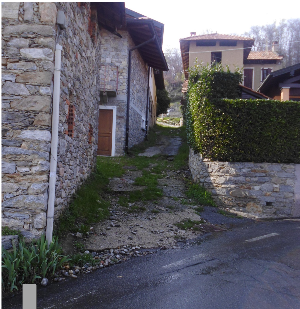
Foto 1: Particolare strada oggetto di rifacimento in corrispondenza dello sbocco su Via per San Salvatore